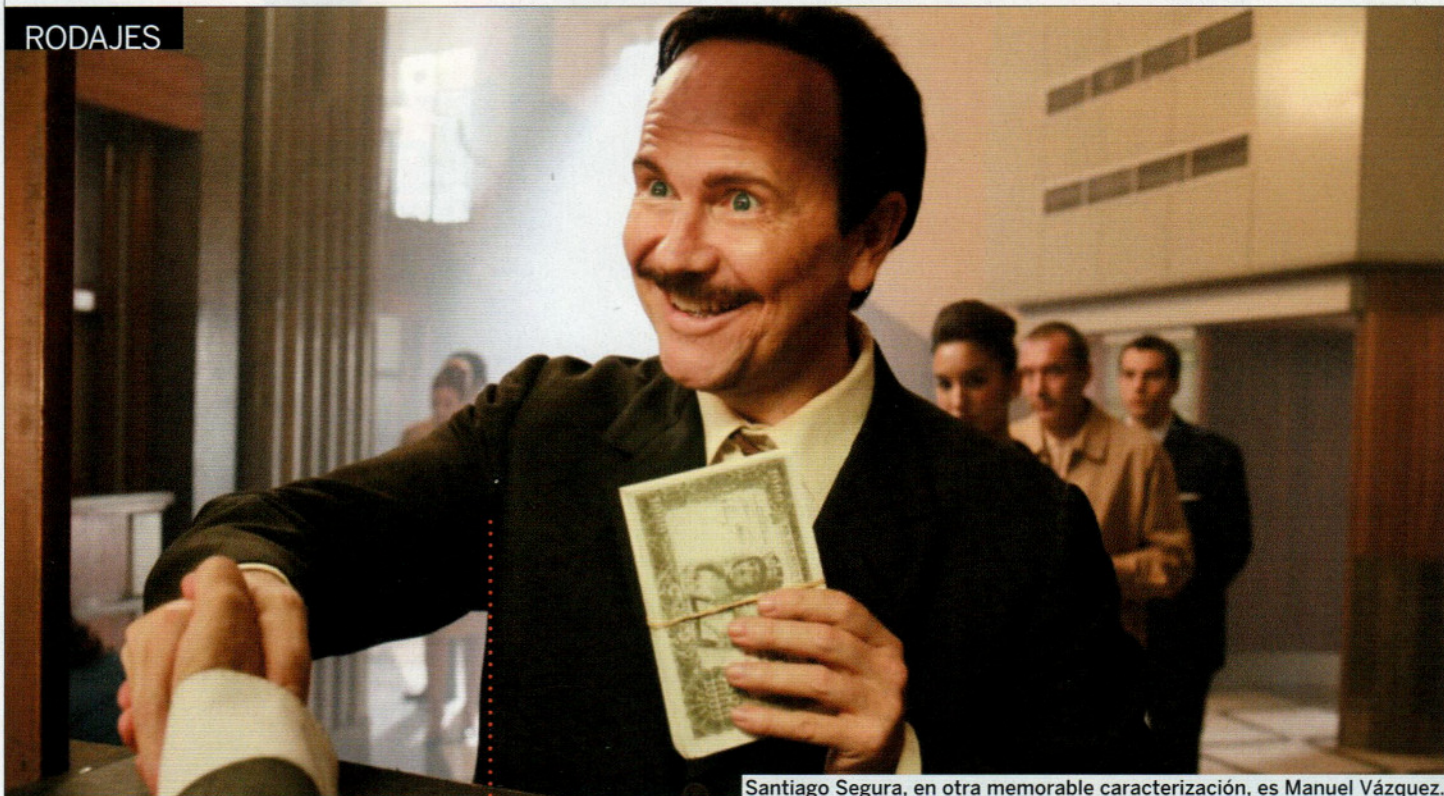
Santiago Segura, en otra memorable caracterización, es Manuel Vázquez.