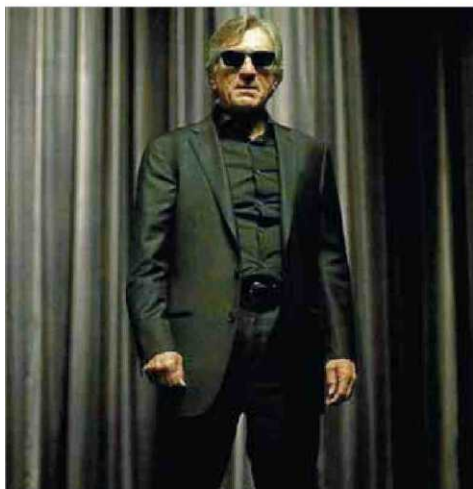
'Catalunya über alles!' i 'Red lights' ■ SEGARRA / WARNER

s'ha portat al cinema un altre celebrat còmic, Arrugas , de Paco Roca. Ignacio Farreras dirigeix aquesta pel·lícula d'animació per a adults sobre l'Alzheimer, que s'estrenarà a la tardor. I el 2012 està previst que s'estreni Tadeo Jones , paròdia de les aventures d'Indiana Jones protagonitzada per un personatge que ja ha aparegut en diversos curtmetratges i que va guanyar un premi Goya l'any 2006.