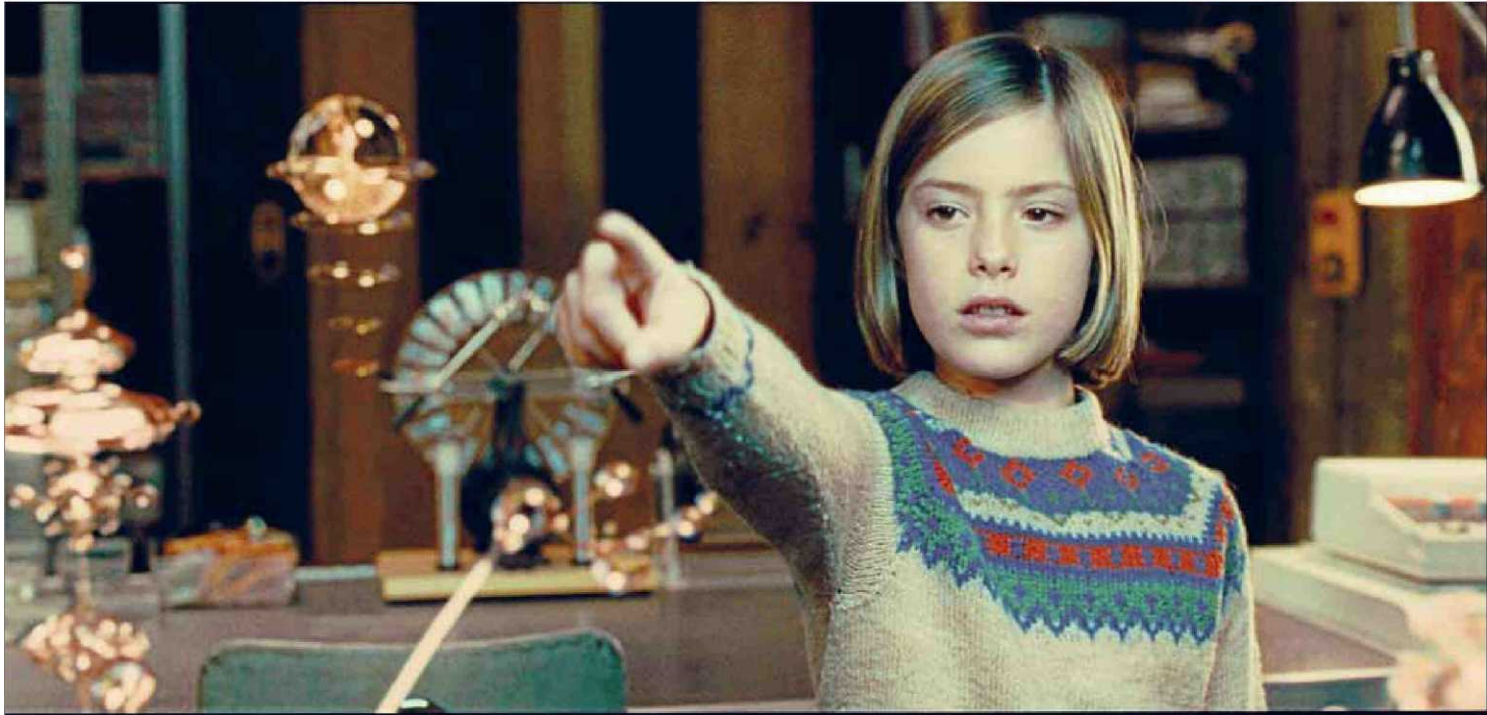
‘Eva’, de Kike Maillo, és una pel·lícula de ciència-ficció que aborda el tema de la intel·ligència artificial